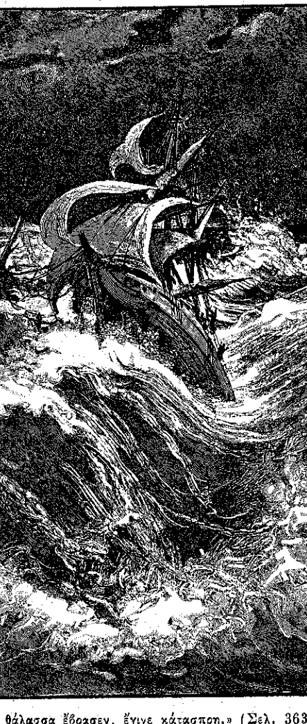
Ἡ θάλασσα ἔβρασεν, ἔγινε κατάσπρη. (Σελ. 363, στήλ. α')

Εὐθὺς ἡ φαλαινὴ τοῦ ὑποπλοίαρχου Ἀλλότ ἐπεσε δίπλα στήν φαλαιναν καὶ τὴν ἔδρασε, ἐνῶ τὸ ἴδιον ἐκαμναν καὶ οἱ ναῦται τοῦ «Ρέπτωνος». Ἀφοῦ τὴν ἔδρασαν, ἄρχισαν νὰ τραβοῦν, οἱ Γάλλοι πρὸς τὸ πλοῖόν των καὶ οἱ Ἀγγλοὶ πρὸς τὸ ἰδικόν των. Ἐννοεῖται ὅτι οὔτε οἱ μὲν οὔτε οἱ δὲ κατῳρθοσαν νὰ προχωρήσουν. Ἐτραβοῦσαν ὀλίγως τὸσον δυνατὰ τὰ κουτιά, ὥστε μετ' ὀλίγον ἐκόπησαν τὰ σχοινία καὶ τῶν δύο λέμβων συγχρόνως.