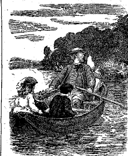
« Ενώ όμως έπλησίαζαν... »

— Νά ή τιμωρία μας!... είπεν ή Κική εις τόν Γιαννάκην.